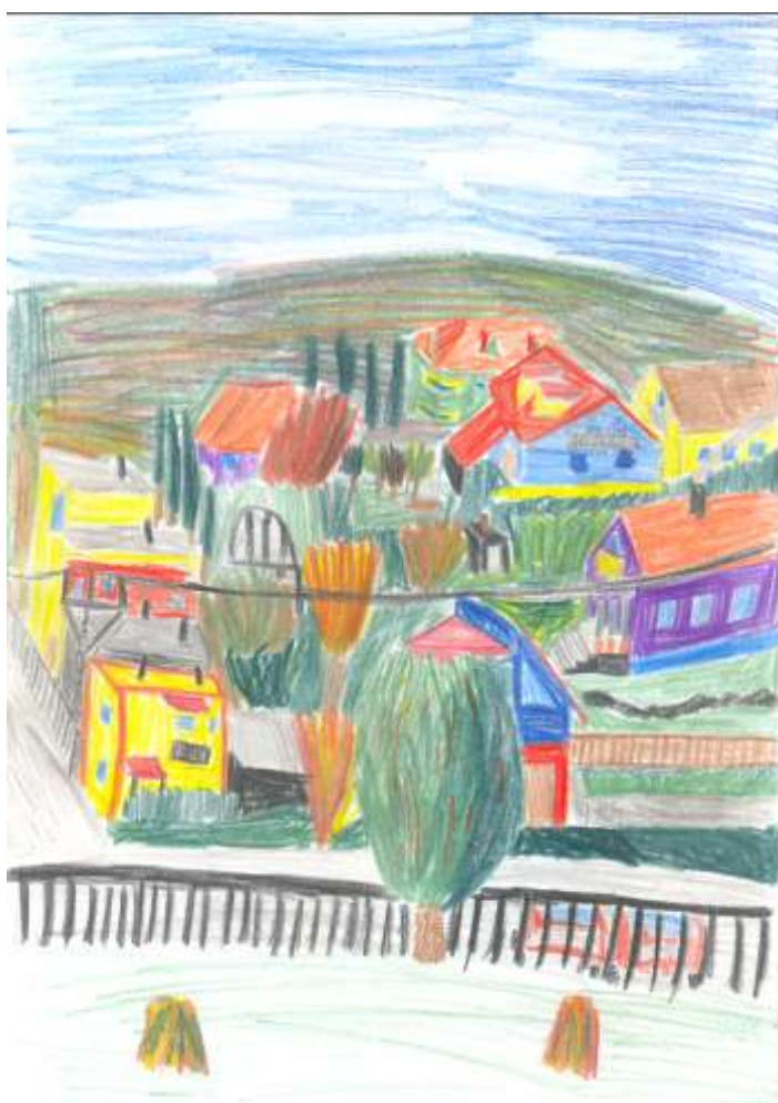
Jakub Kolárovský VII.A

Nájdete nás aj na : http://zsjanigova.edupage.org